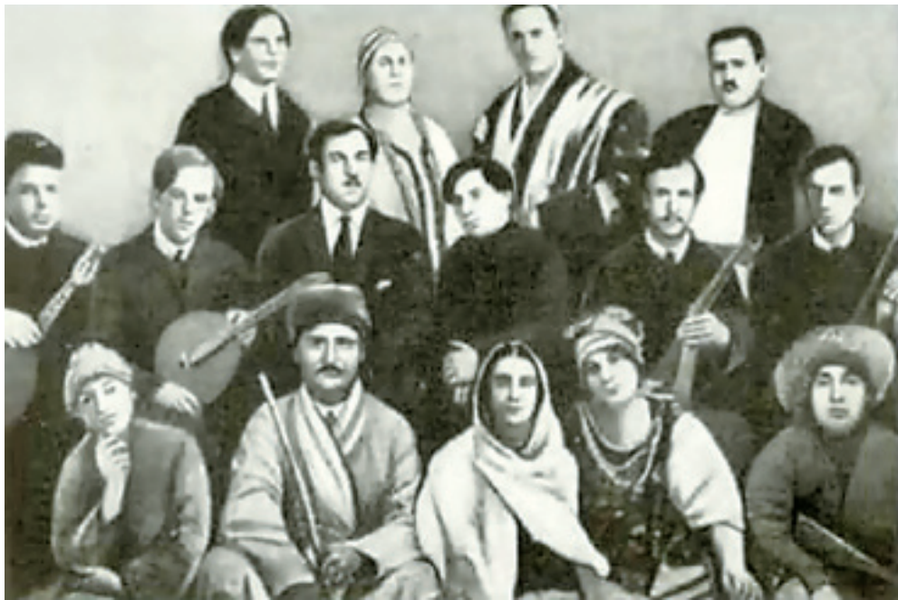
Майндағы Франкфурт калаһы, 1927 йыл

Уралды Урал иткән — Курай. Ә Курайзы Курай иткән — Курайсылар. Курай йылғызмаһына юйылмас юлдар язған Йомабай курайсы башкорт халкының күңелендә мәңгелек урын алған.